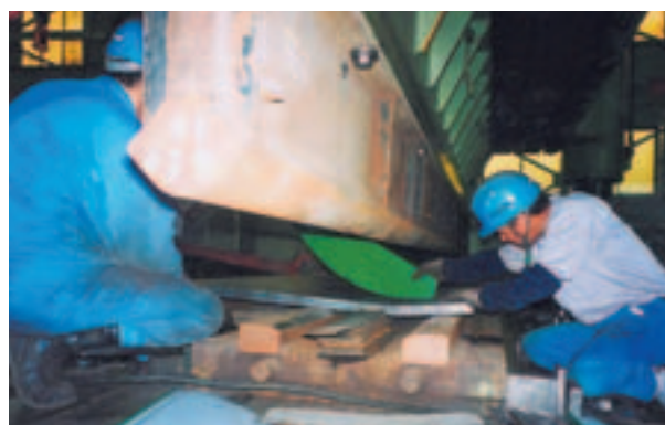
写真1 下フランジ曲げ加工状況

a)～g)の結果より、1ブロック（7.0～8.8 m）の部材の曲げ加工だけであれば部材として加工可能ですが、更に平面線形と縦断線形およびキャンバーのライズ付けを行った場合、冷間加工・熱間加工どちらにしても捻じれが生じることが予想されました。今回の試験では加熱によるライズ付けを試みましたが、所定量3.2 mmに対して、1.5～2.5 mm付きましたがそれ以上加熱を行うと、第1段階で加工