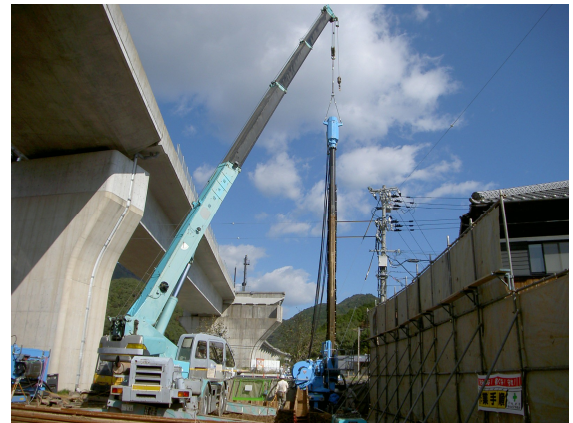
鋼矢板圧入状況（全景）

この工法は、まずパイルオーガで最小限の掘削を行い、地中に芯をくり抜いた状態にします。そしてパイルオーガを引き抜きながらその隙間に矢板を圧入していく方法です。掘削は圧入補助として最小限に抑えるため、排土量は少なく、周辺地盤を乱すことなく鋼矢板を圧入することができます。