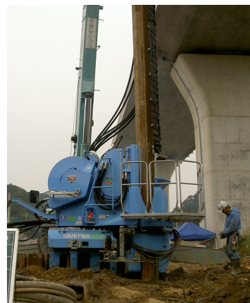
鋼矢板圧入状況（硬質地盤クリア工法）

この工法を採用することにより、近接住宅に騒音・振動や地盤沈下の影響を及ぼすことなく、施工を行うことができました。