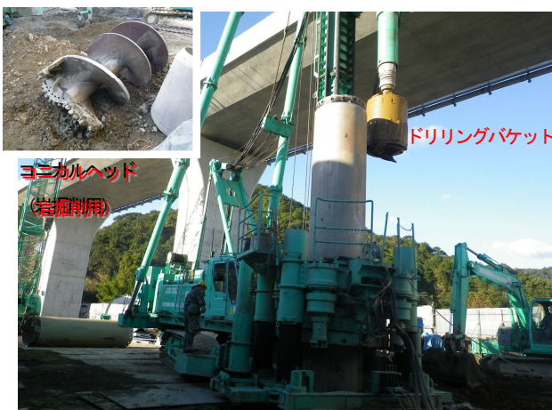
ベナースB工法による掘削排土状況