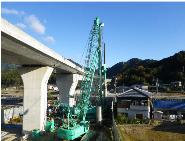
場所打ち杭施工状況（施工箇所全景）

これに対して今回採用したベナースB工法は、3点式杭打ち機にドリリングバケットを取り付け、それをケーシング内部で回転させることによりケーシング内部の土を取り込み掘削・排土する工法です。岩や玉石層の場合には、ドリリングバケットからコンカルヘッドに取り替えて岩や玉石を砕いてから排土します。この工法を採用することにより掘削時の騒音・振動を低減することができました。