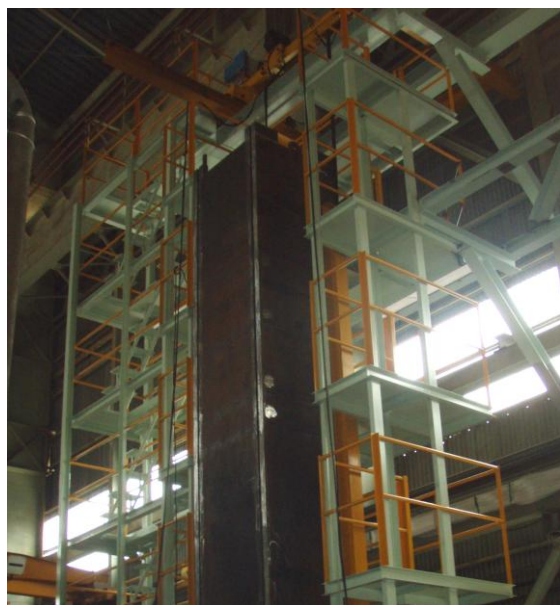
昇降階段と作業ステージ