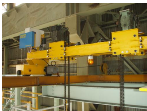
牽引装置の回避復帰機構

この牽引装置はボックス柱の真上に配置する必要があり、入れ替え毎にボックス柱の最上部より更に高い高所において回避、復帰させる作業が発生していたために、作業者の大きな負担となっていました。この対策として遠隔操作（コードレス）で移動できるように改良することにしました。従来では高所の玉掛け作業員 2 名と低地での配置確認者 1 名が必要でしたが、高所作業が不要となり作業負担を大幅に軽減することができました。