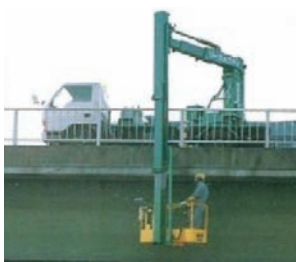
ゴム栓の撤去状況