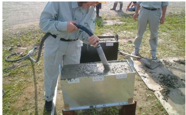
止水試験状況（コンクリート打設）