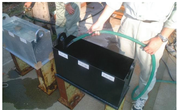
止水試験状況（水の注入）