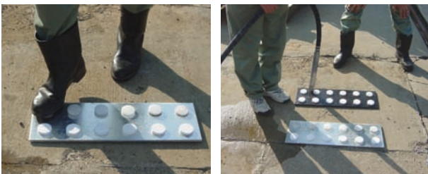
強度試験状況（足で踏む、バイブレーター）