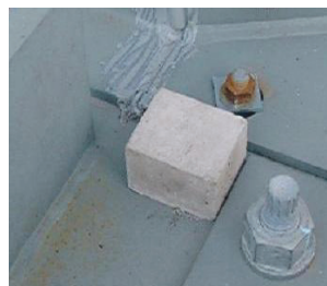
コンクリートブロックの使用例