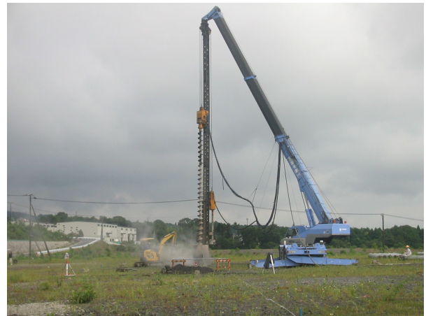
ダウンザホールハンマー掘削工事状況

施工の結果は、大きい転石も問題なく掘削出来ました。また、支持層が浅く岩盤の掘削長が長くなった場合でも設定した杭長で施工出来ました。支持層が想定より深いところも数箇所ありましたが、杭を再製作することにより対応しました。これは想定内の範囲内でした。ちなみに、岩以外の層の掘進スピードは一般の掘削工法と同程度でした。