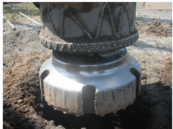
ダウンザホールハンマー先端ビット